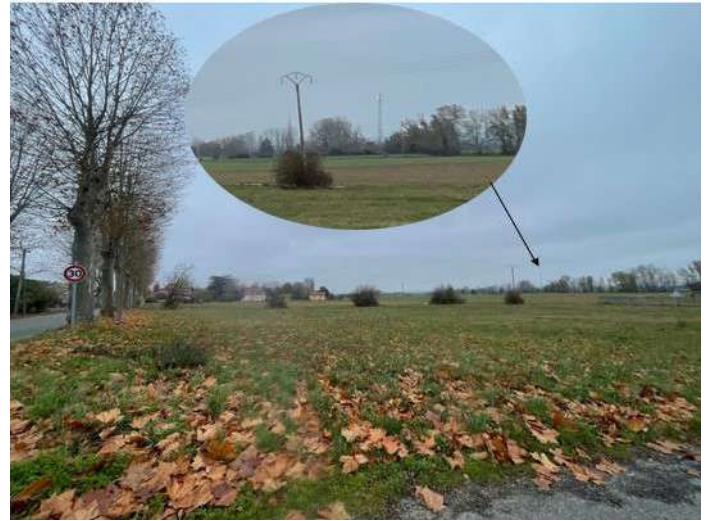
Prise de vue 3