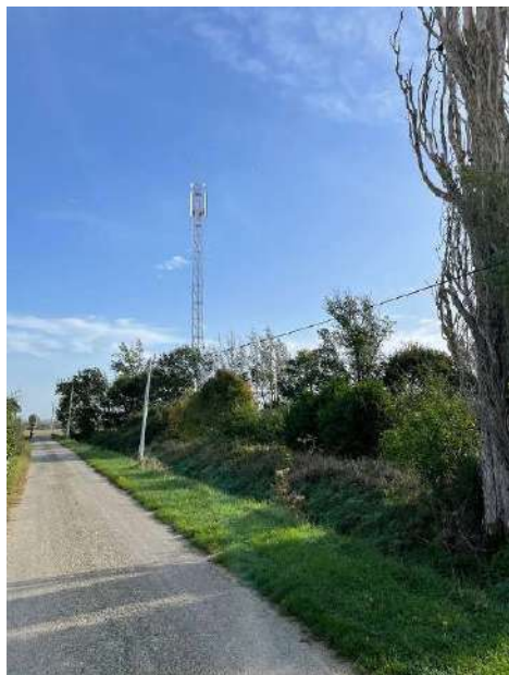
Prise de vue 1