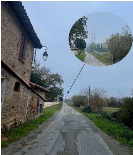
Prise de vue 2